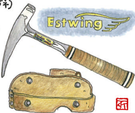
建築家・田附尚のひとりごと。

化石採集や地質調査用具の世界スタンダードとされている。世界中の研究者、学生、調査員、プロフェッショナルの絶大な信頼を置いて愛用している。